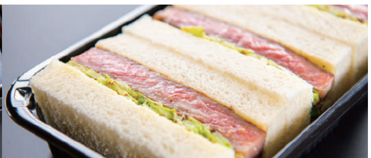
とちぎ和牛ステーキサンド 3,000円