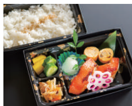
金目鯛白醤油焼き弁当 1,400円