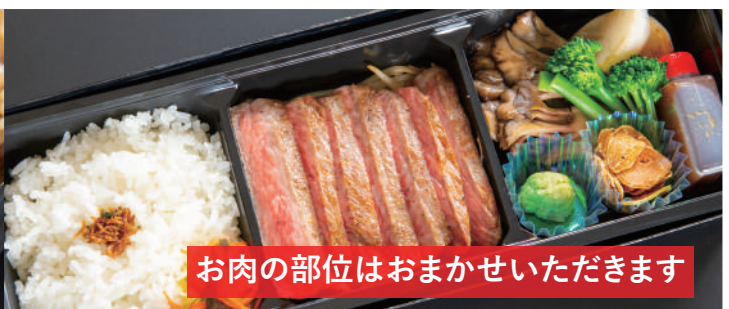
【数量限定】とちぎ和牛おまかせステーキ弁当 100g 3,200円/150g 4,300円/200g 5,400円