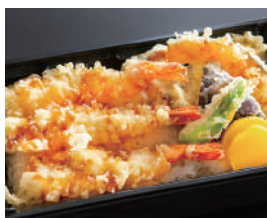
海老と季節野菜の 天重弁当 1,200円