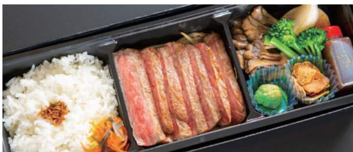
とちぎ和牛ステーキ弁当(フィレまたはサーロイン) 100g 4,300円/150g 5,900円/200g 7,500円