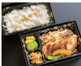
鮪ステーキ弁当 1,400円