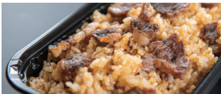
とちぎ和牛入りガーリックライス(300g) 1,600円