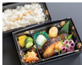
銀鱈西京焼き弁当 1,400円