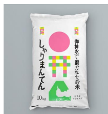
△日光産「しゃりまんてん」