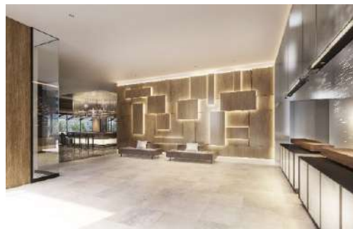
△エントランス (イメージ)