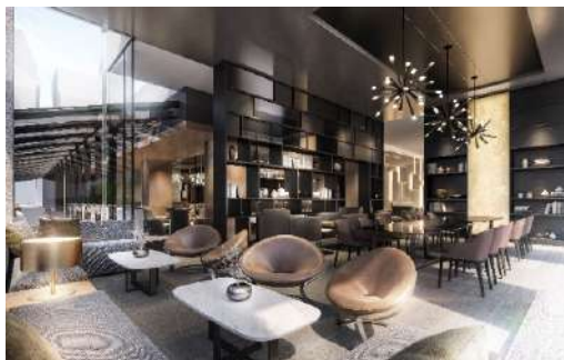
△AC Lounge ® / Library (イメージ)