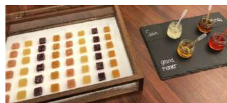
△パートドフリュイ (イメージ)

チェックイン時間に合わせ、食前酒か食後酒を加えてゲストの前で仕上げるパートドフリュイというお菓子をご提供する、ACホテル独自のヨーロッパスタイルのおもてなしで、心を込めてお出迎えいたします。