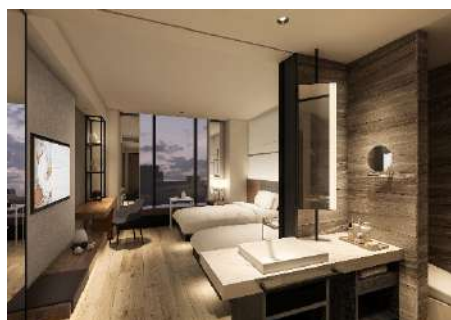
△スタンダードルーム (イメージ)