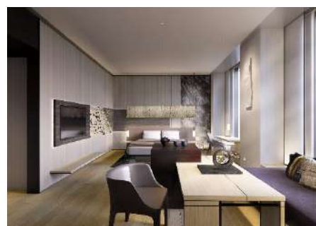
△プレミアムルーム (イメージ)

国内初となるACブランドが紡ぎだすストーリーをゲストに最大限お楽しみいただき、高い満足と何度も泊まりたくなる期待感をもたらすよう、高品質なサービスと、ゲストが楽しみ、かつリラックスできるさまざまな演出をご用意いたします。