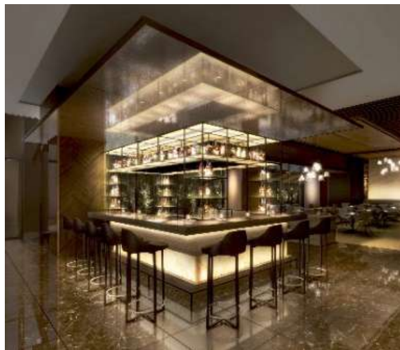
△AC Lounge® / Bar (イメージ)

ACブランドのシグニチャードリンクであるジントニックやスペインの伝統料理を忠実に追究したメニューに加え、和のアレンジを加えたイノベティブタパスを提供するとともに、-5℃まで温度設定が可能な日本酒セラーを備えるなどビバレッジにもこだわり、ACホテルの中でも当ホテルでしか味わえない銀座ならではのサービスを提供いたします。