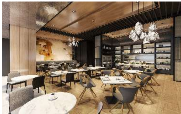
△AC Kitchen (イメージ)

食材を細部に至るまで厳選し、生ハムや拘りのコーヒーなど、ACブランドのコンセプトをご体感いただけるメニューをご用意しつつ、銀座ならではの和の要素と融合させたメニューをご用意するなど、和のエッセンスを感じさせるモダンなプリフィクスランチを提供いたします。