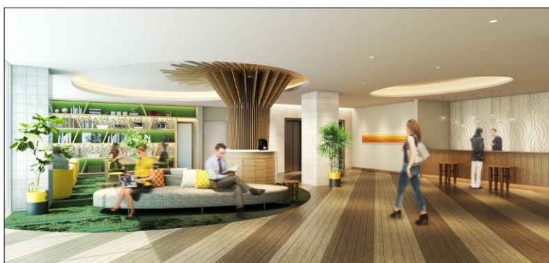
△ホテルロビー（イメージ）