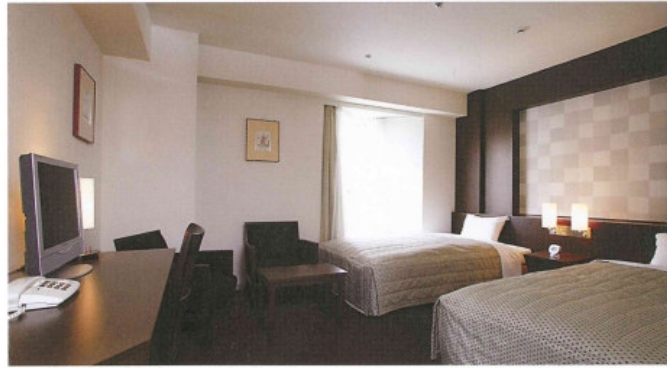
Twin room / ツインルーム(B)