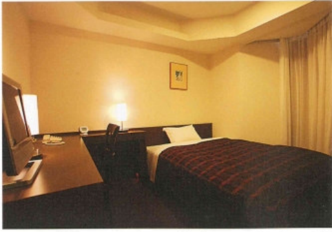
Single room / シングルルーム(B)