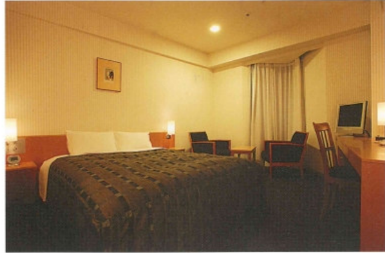
Double room / ダブルルーム(C)