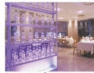
カフェレストラン「ヴェルデジュール」

We work hard to make sure all of our guests enjoy a good night's rest. Our attention to the comfort of guests extends to luxurious beds, so you wake up fresh and ready for each new day.